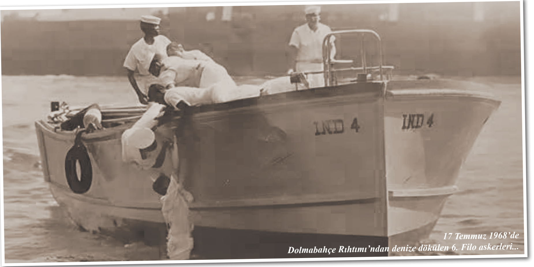
17 Temmuz 1968'de Dolmabahçe Rıhtımı'ndan denize dökülen 6. Filo askerleri...